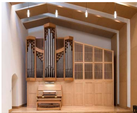
ベッケラートオルガン