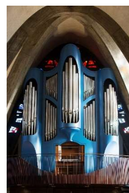
フィスクオルガン

立教学院諸聖徒礼拝堂(池袋チャペル)のオルガンは、英国のティッケル社が製作した英国・ロマン派様式のオルガンで、2013年に設置されました。また、池袋チャペル会館2階のマグノリア・ルームに設置されているオルガンは、以前、池袋チャペルに設置されていたドイツ・バロック様式のベッケラートオルガンをリメイクし、移設したものです。